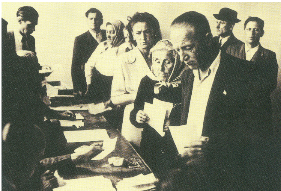
Zájem o volby byl obrovský i na sloveském venkově

únorové krize v projevu na Staroměstském náměstí: „ Chceme tuto krizi řešit ústavně, demokraticky a parlamentárně na základě široké Národní fronty. “ 17